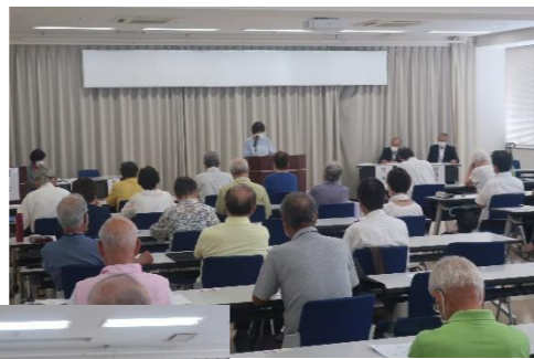
▶発表を行う班長さん