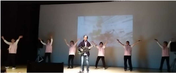
▲シニアワークフェアでも大活躍！！

センターのテーマソングに合わせたダンスを一緒に踊っていただける会員を募集します。ダンスに自信がある方、また運動不足な方、この機会に体を動かして一緒に踊りませんか。応募は事務局の屋敷まで。