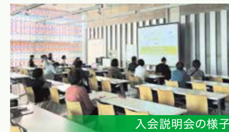
入会説明会の様子