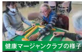
健康マージャンクラブの様子

また、平成27年10月に健康マージャンクラブを同好会として設立しました。翌年4月には、親睦会定期部会に承認され、