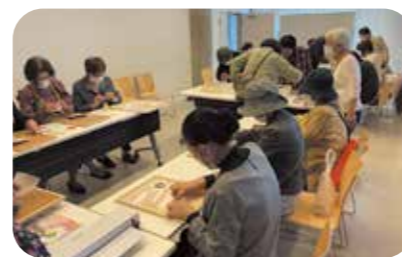
女性委員会によるペーパーリーフアート講座