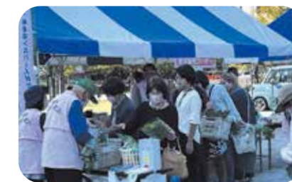
シルバーマルシェ(野菜等販売)