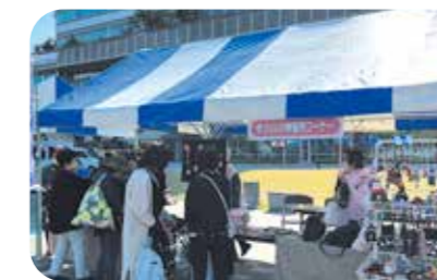
手づくり小物販売