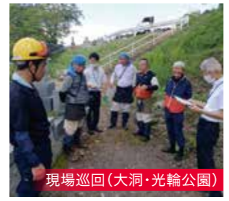
現場巡回(大洞・光輪公園)

事務局では、10月に「緊急告知」として、実態を会員に知らせ、事故防止を啓発するチラシも作成しました。それで