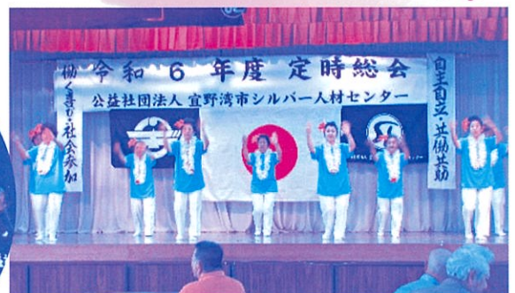
▲ 新城老人クラブレク部

披露曲 ハイサイおじさん 砂辺の浜 赤田首里殿内 海のチンボーラー小 かたみ節 他