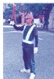
▲令和7年7月3日(木) 請負：空きスペース案内 現場：しのめこども園