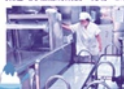
▼令和7年7月2日(水) 派遣：調理補助業務 現場：こがねの森保育園