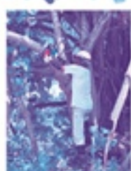
▼令和7年7月2日(水) 請負：草刈作業 現場：市民広場