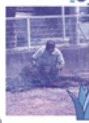
▲令和7年7月2日(水) 請負：草刈作業 現場：新城児童センター