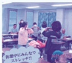
休憩中にみんなでストレッチ!!