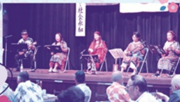
▲ 外部団体：サンレサークル♡アイルアーナ

竹富島で会いましょう 若者たち バラが咲いた 22歳の別れ Hey Jude 等