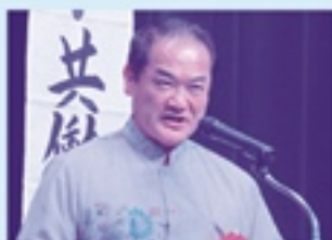
宜野湾市長 佐喜眞 淳