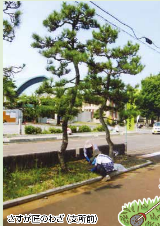
さすが匠のわざ (支所前)