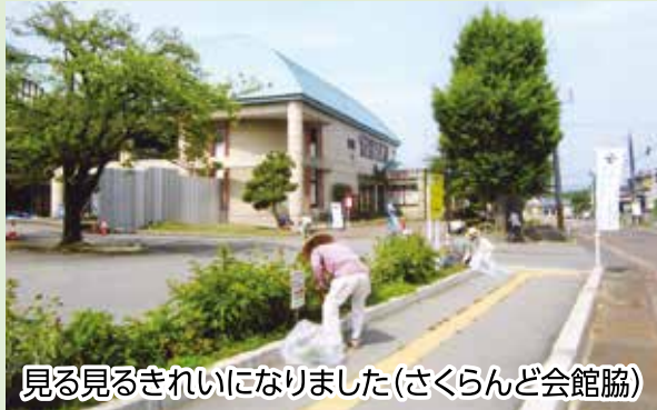
見る見るきれいになりました (さくらんど会館脇)