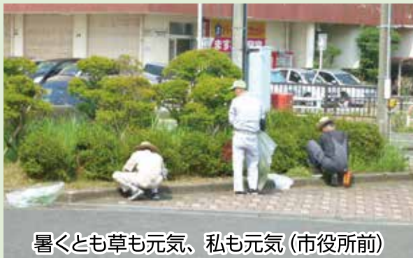
暑くとも草も元気、私も元気 (市役所前)