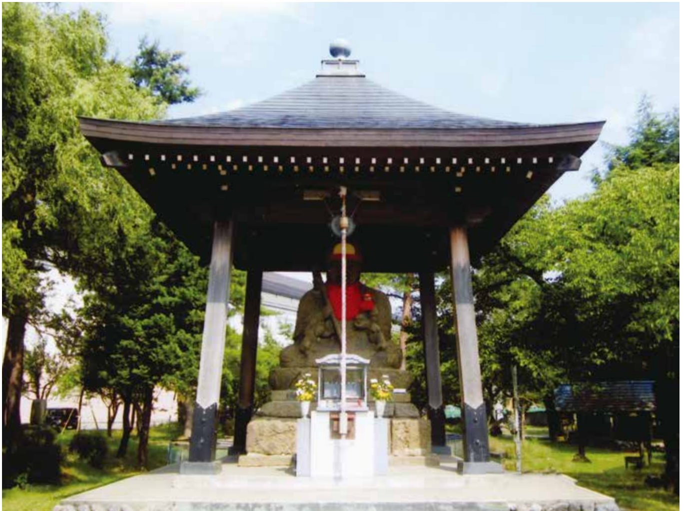
文化財シリーズ① 子安延命地藏尊有形文化財 (8月23日大祭)