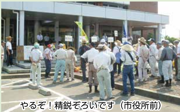
やるぞ！精鋭ぞろいです (市役所前)

七月二十一日(土)、約一五〇名の会員が除草作業を行いました。連日の猛暑の中、この日も三十四度を超える暑い日でしたが、そこはベテランぞろい、手際の良さで午前中で終了。予定していた五泉市役所周辺と村松支所周辺が見違えるほどきれいになりました。皆さん、お疲れ様でした。