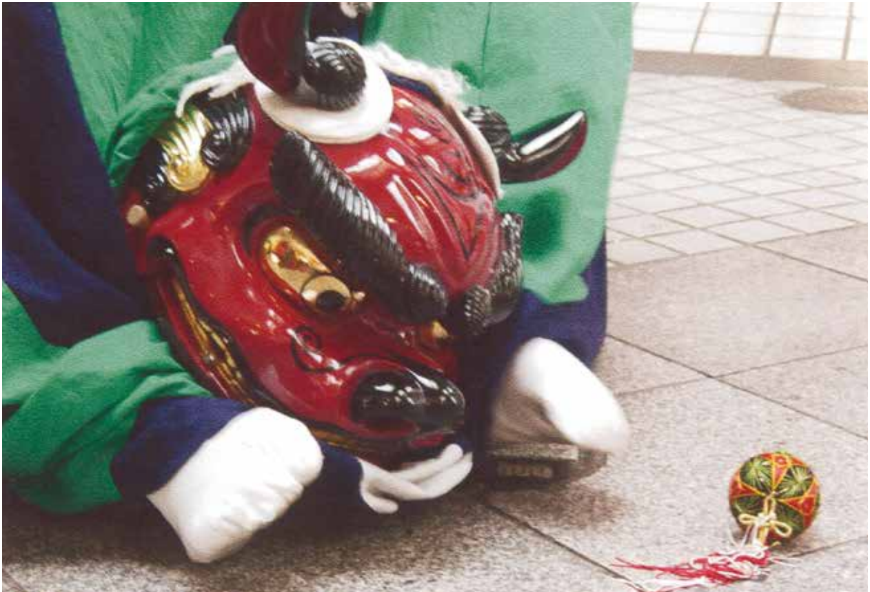
文化財シリーズ② 蒲原神楽民俗文化財