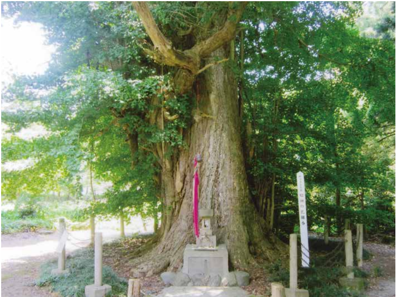
文化財シリーズ③ 切畑の乳銀杏 (県指定天然記念物)