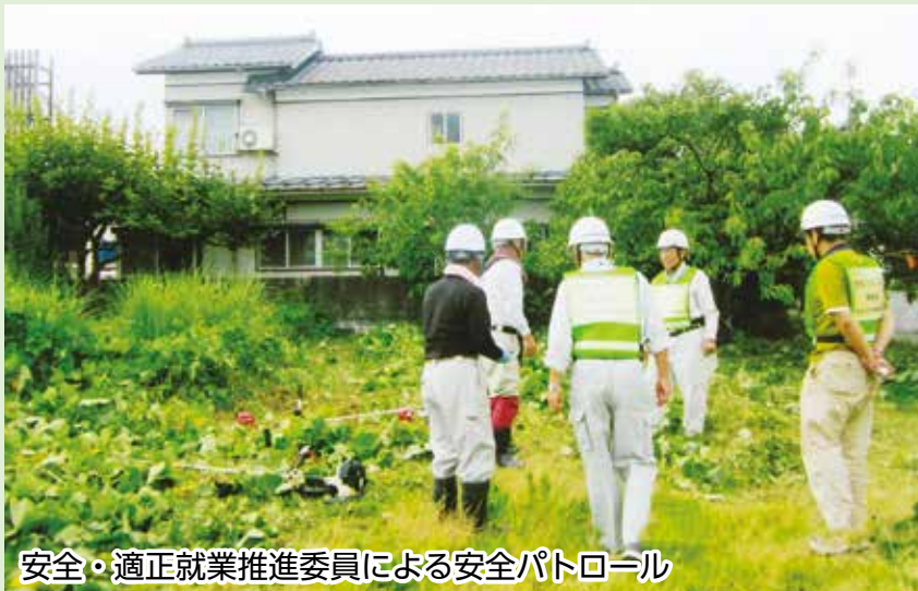
安全・適正就業推進委員による安全パトロール