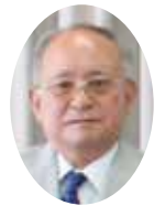
安全適正就業推進委員会

つきましては、経験を生かすという意味からもシルバー人材センターの活動を積極的に取り組んでいただき、社会貢献と地元の活性にご協力いただきたいと思います。「共働・共助・共楽」をモットーに、もう少しの期間「理事長」として頑張ろうと思っておりますので、よろしくお願ひします。