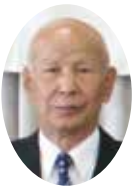
事業活動推進委員会

さて、昨今は就業事故(傷害・賠償等)が増加傾向にあります。これからは熱中症も含め事故の減少を図り事故「ゼロ」を目指して委員会活動を展開して参ります。解決策の一環として安全研修会の実施、安全パトロール等を通じて事故撲滅の徹底を図って行きたいと思っております。会員皆様のご理解とご協力のほど宜しくお願ひ申し上げます。