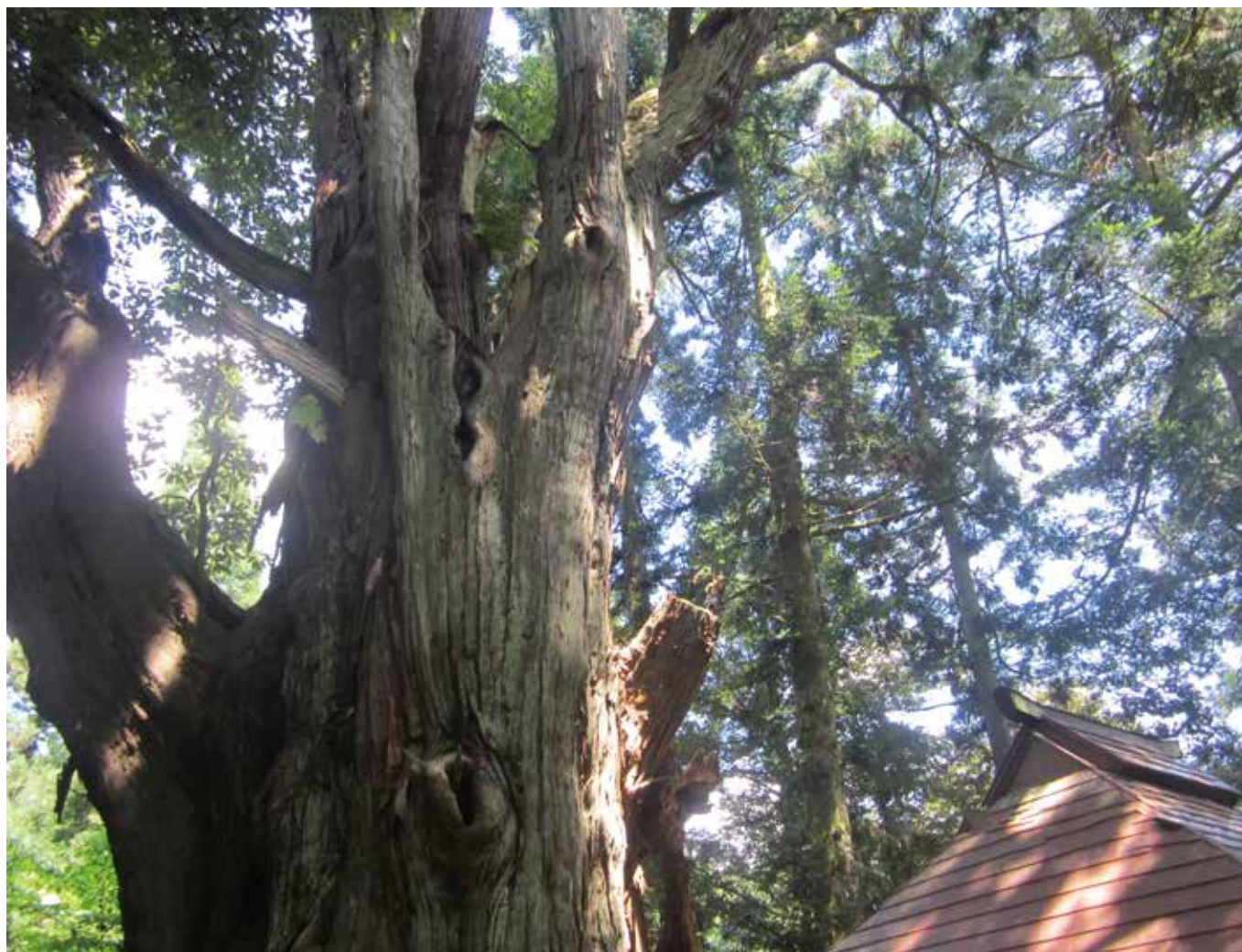
文化財シリーズ⑤ 館之内の大杉 (丸田地内)