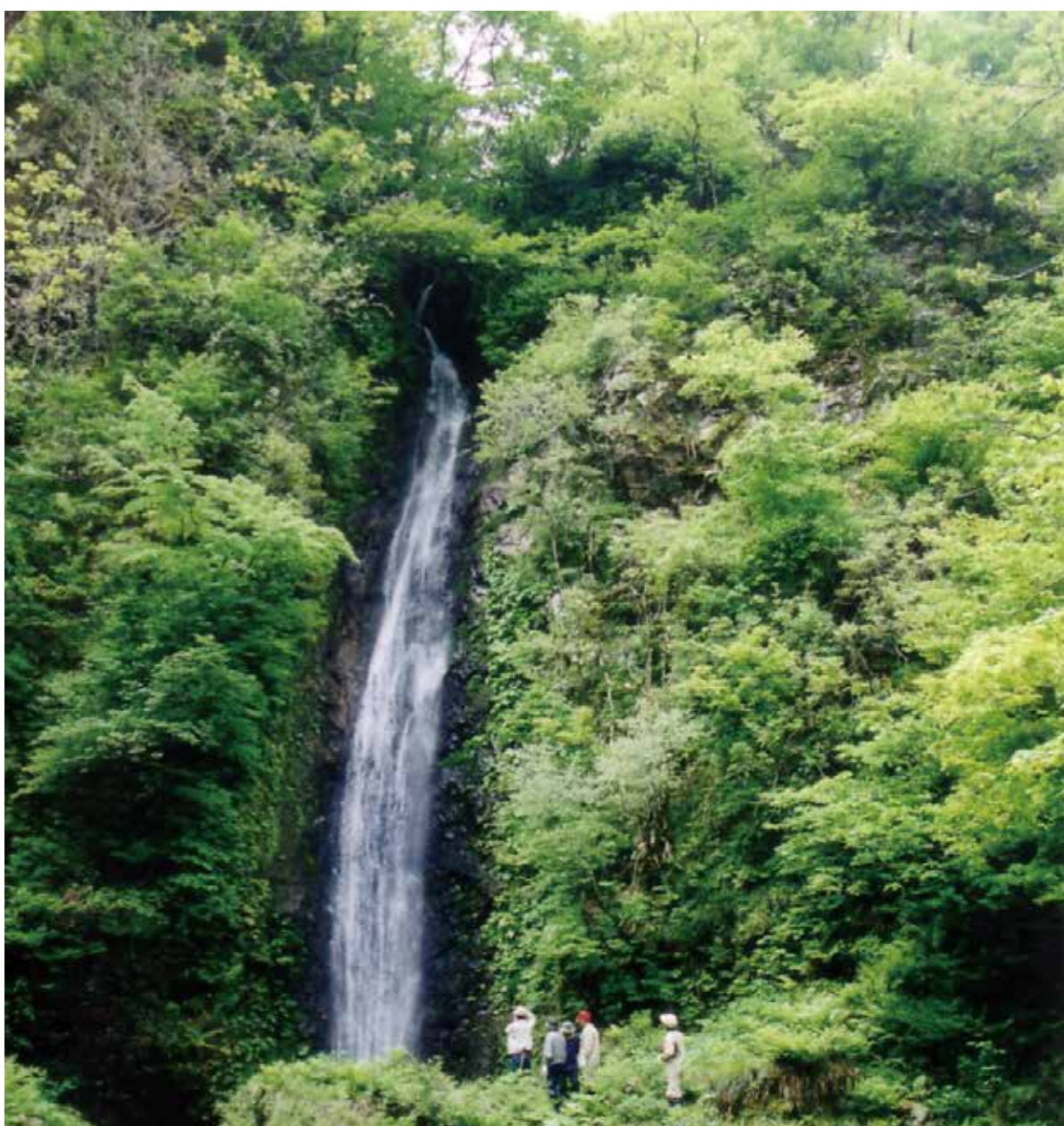
文化財シリーズ⑦ 視後平の滝 (小面谷地内)