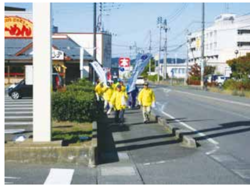
市道沿いのごみ拾い