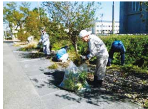
村松地区体育施設の除草・清掃