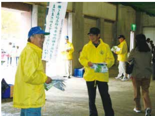
11/3農業まつりパンフレット配布