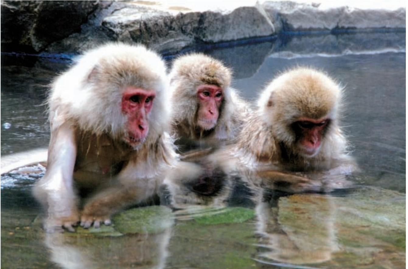
長野県：地獄谷温泉