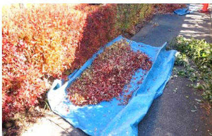
植木ゴミがまとめられている様子