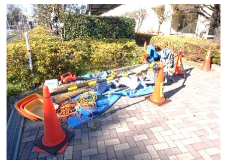
使用器具・工具類はシート上にまとめて置かれている