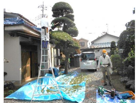
刈り込み作業中、ブルーシートで受けている