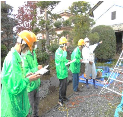
尾又リーダーへの聞き取り調査