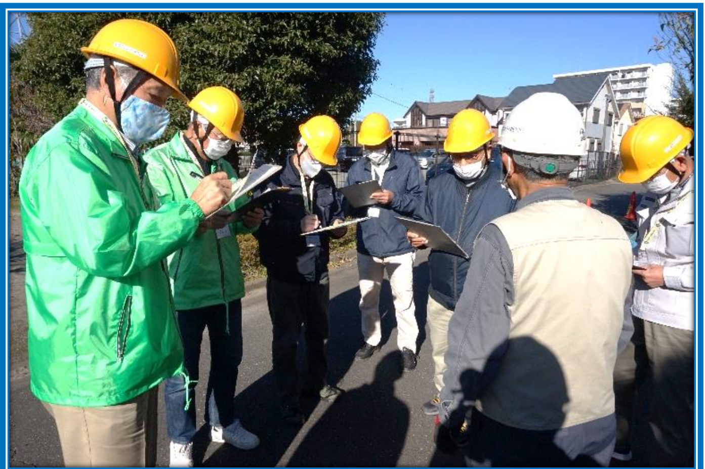
理事・監事による安全就業パトロールの様子