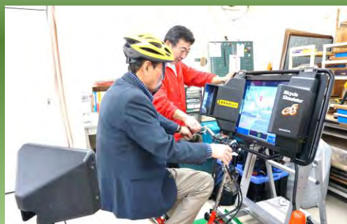
シミュレータ体験の 様子