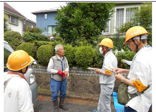
安全就業パトロールの様子