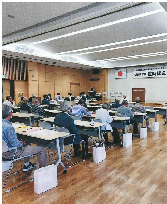
令和5年度 定時総会