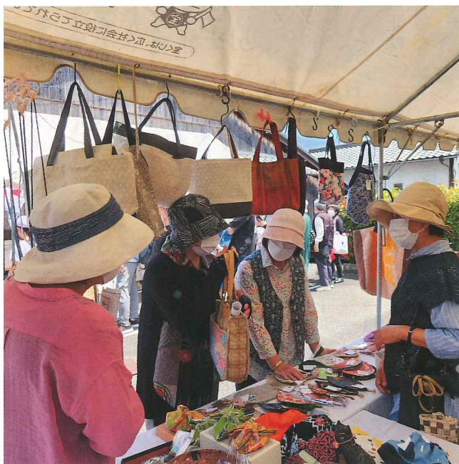
「浜崎伝建おたから博物館」に出店