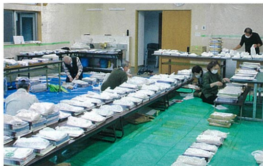
萩市報等の仕分け作業