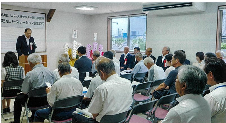
■会員さんの活動の様子■