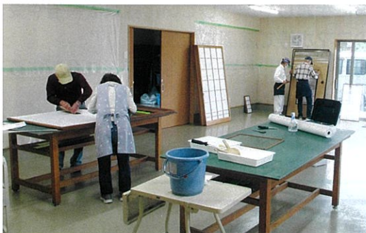
ふすま・障子の張り替え