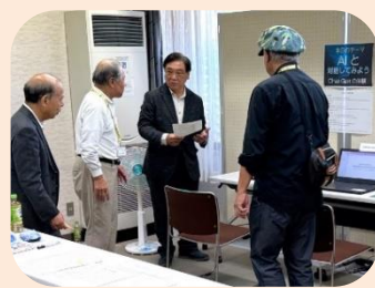
パソコンサークル 生成AI体験会