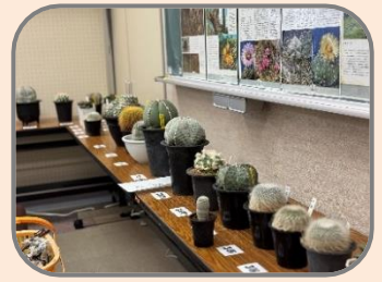
抽選会景品のサボテン