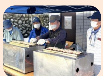
焼き鳥(自転車整理班)