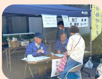
実演コーナー (刃物研ぎ・網戸張替え)