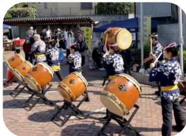
和太鼓演奏(羽村市太鼓普及会)

市長・富松市議会議長からご挨拶をいただきました。今回、初めての10月開催となりましたが、当日は天候にも恵まれ、昨年を上回る多くのお客様にご来場いただきました。第30回を記念した豪華なサボテンが当たる抽選会や、バルーンアートのプレゼント、射的、輪投げといった子ども遊びコーナー、焼きそば、焼き鳥等の模擬店や着付教室等の各種教室及びサークルの展示も大変好評で、多くの方に楽しんでいただけました。会員の皆様のご協力ありがとうございました。