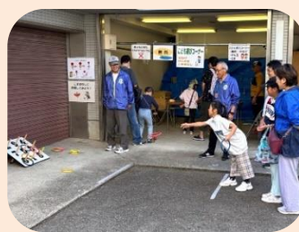
子ども遊びコーナー