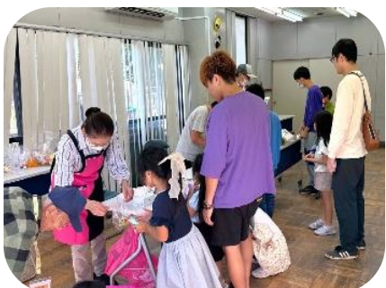
くじ引き・スーパーボールすくい (地域班5・6班)