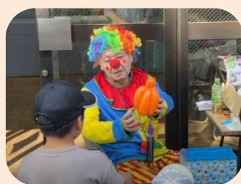
バルーンアートプレゼント