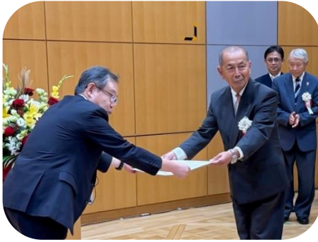
（中川安全・適正就業推進委員長）