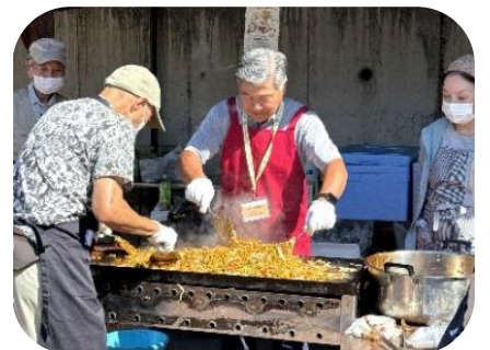
焼きそば (地域班1・2班)