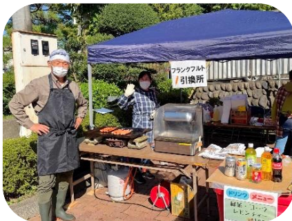
フランクフルト・飲み物 (地域班3・4班)