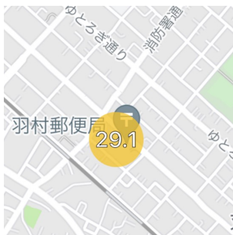
(羽村市の気温等が表示されます)

暑さ指数の基準としては、 暑さ指数が28度～31度で嚴重警戒、31度以上で危険 とされています。