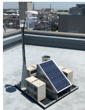
(市役所屋上の観測機)

梅雨が明け、急激に気温が高くなってきています。また、今年は昨年引き続き、マスク着用の機会が増えており、例年以上に熱中症に気をつける必要があります。 スマートフォン向けアプリの「POTEKA(ポテカ)」 を利用すると、現在の羽村市の気温や 暑さ指数(熱中症の危険度を判断する数値) を簡単に調べることができますので活用しましょう。