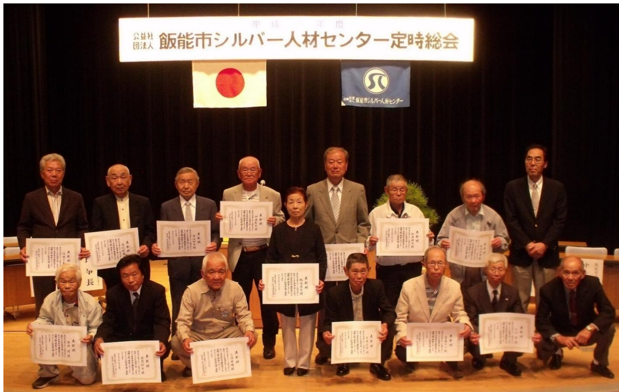
【15年及び10年表彰者の皆さん】