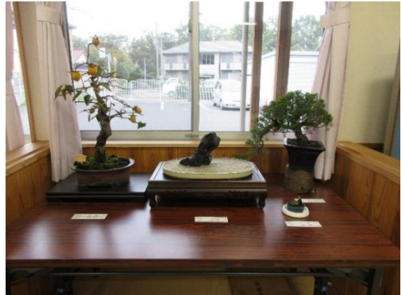
昨年の展示会の様子（令和2年10月19日から10月30日まで）