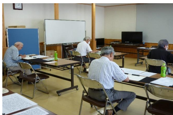
昨年の「写経体験会」の様子