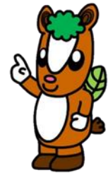
けんこう大使 飯能市イメージキャラクター 夢馬（むーま）

毎年4月にお送りしている受診券をご確認ください。 通院中の方も受けることができます！ ※詳しくは、同封のチラシをご参照ください