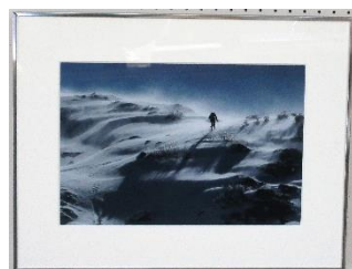
(昨年の出展作品の一部)