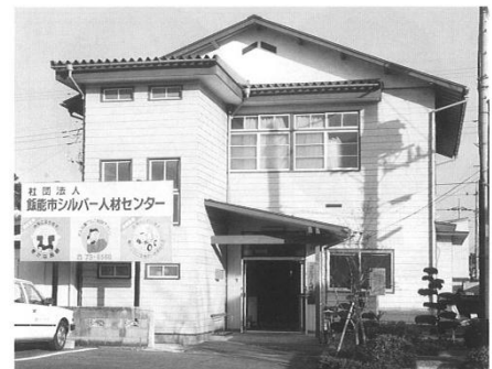
今から30年前(平成5年頃)の事務所と職員の集合写真です。