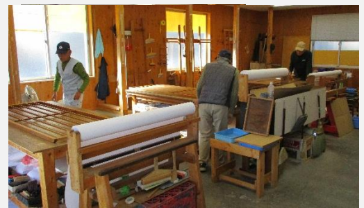
(作業場での仕事風景)