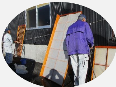
(古紙や糊の除去清掃作業)

和風家屋が減少しているとはいえ、年間を通して受注依頼のある大変やりがいのある仕事ですので、ご興味のある方は事務局までご連絡ください。