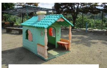
加治東保育所の様子