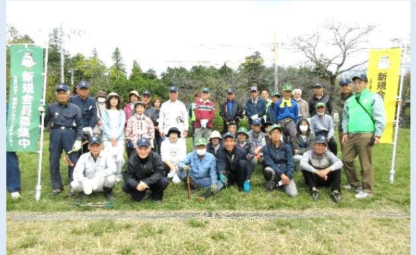
(昨年の清掃奉仕活動の様子)