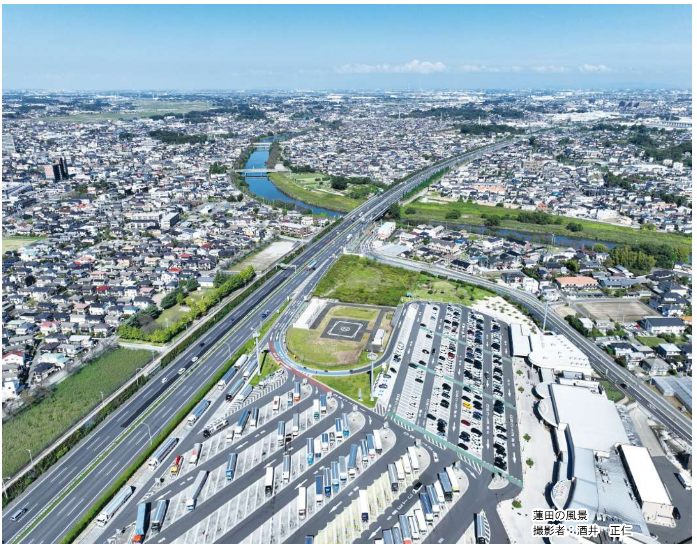
蓮田の風景

公益社団法人 蓮田市シルバー人材センター 〒349-0101 蓮田市大字黒浜 2799 番地 1 蓮田市役所西棟 1階 ☎048-768-3110