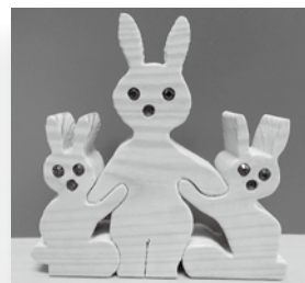
シルバー木遊会 会員の作品です