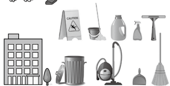
事業所内清掃・昼食準備等