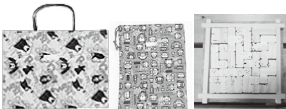
通園・通学袋、小物、木工品の作成