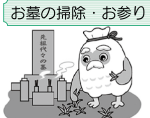
お墓の掃除・お参り