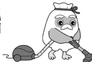
家事援助サービス 掃除・洗濯・買物等