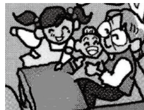
育児支援サービス 産前産後の家事支援 子供の見守り、遊び相手