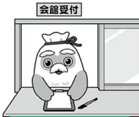
公民館・駐車場 管理、宿日直等