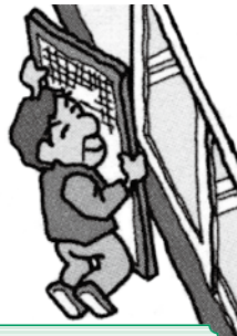
・障子・網戸 ・襖の張替