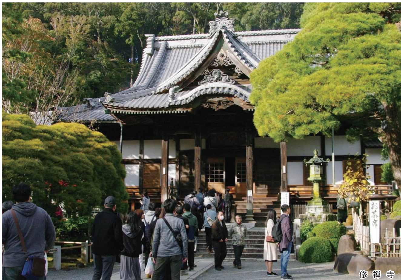
修 禅 寺

発行：公益社団法人東松山市シルバー人材センター 発行日：平成31年1月1日 東松山市小松原町17-19 TEL：0493-22-2245 FAX：0493-22-7655