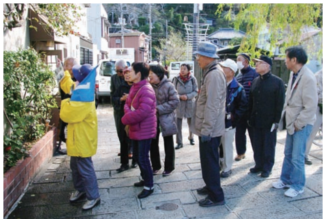
観光ガイドさんと一緒に下田街中を歩く

3月に日帰研修旅行を計画して おります。詳細が決定しましたら、 ご案内致します。