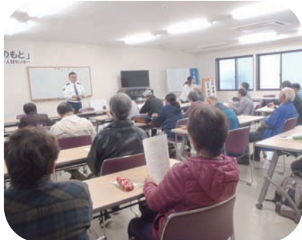
自転車乗り方講習会