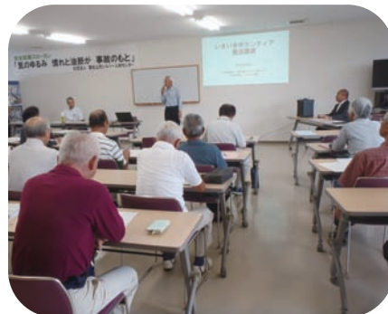
ボランティア養成講座