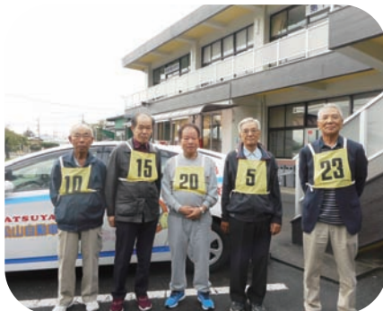
シルバードライバーチャレンジ