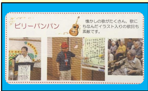
訪問先の広報紙で紹介された「ビリーパンパン」のボランティア活動状況

今はコロナ禍でボランティア活動は休止中とのことですが、一日も早く終息し、再開できる日が来ることを願っています。