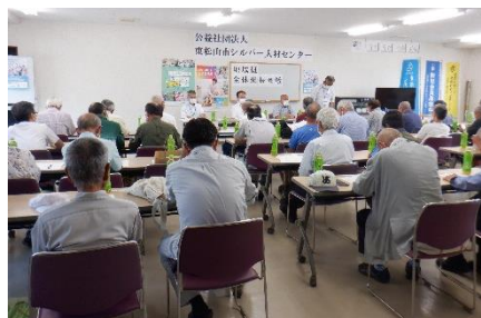
全体班長会議(6月開催)