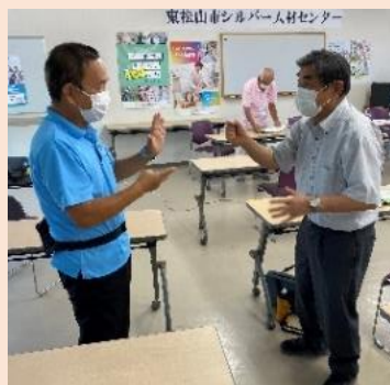
じゃんけんによるフレイル予防 予想以上に楽しかった!