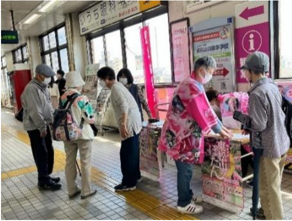
電車が到着するとお客様が次々と