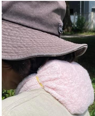
保冷剤を入れたタオル