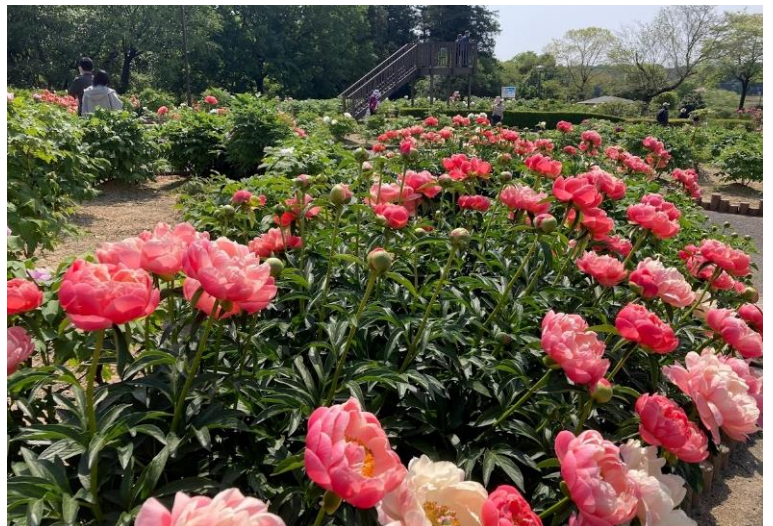
4月25日・牡丹咲き誇る様子

「来年もまた、たくさんの方々に東松山のぼたんを楽しんでほしい」、それが今年この仕事に携わったみんなの共通の思いです。