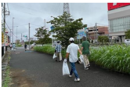
ゴミ拾いボランティア(高坂地区)