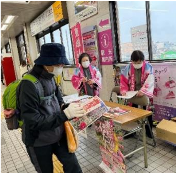
東松山名物「やきとり」店のチラシも