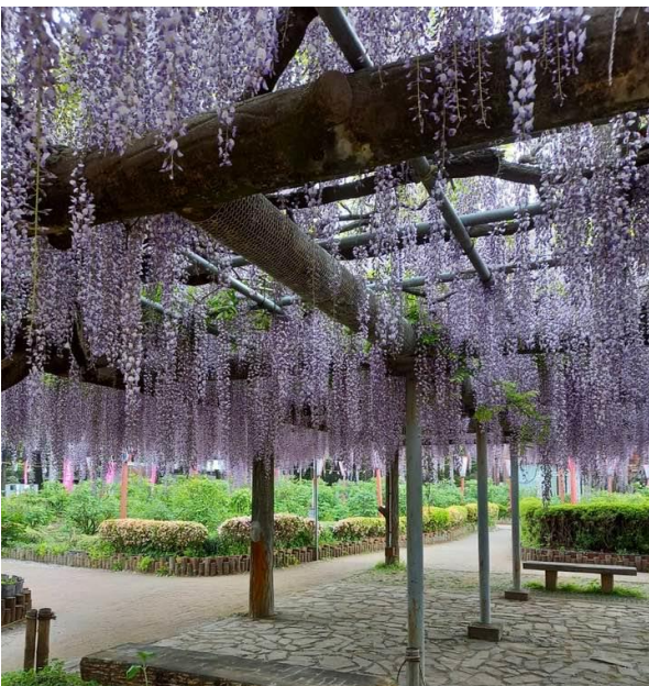
5月3日・箭弓稻荷神社の藤

令和5年4月15日から5月7日まで東松山ぼたん園でぼたん祭りが開催されました。観光協会から東武東上線東松山駅で電車を利用してぼたん園へ向かう方々に園のパンフレット、バスの時刻表、東松山の飲食店チラシなどをお渡しする、また、お客様の質問にお応えするという仕事をいただきました。女性会員11人、交代(ローテーション)でおこないました。