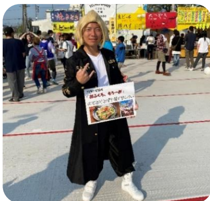
会場が盛り上がる