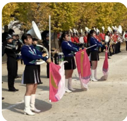
パレードの開会式 大学生によるファンファーレ