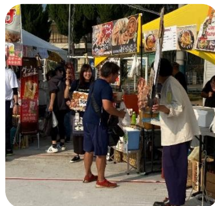
売店が30軒！（焼き鳥もあり！）