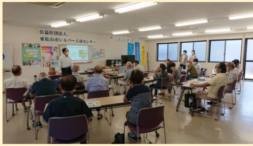
スマホ教室講習風景 熱心に聞き入る会員の皆さん

内容はSNSサービスの種類やLINEの特徴、アカウントの作成、パスワード作成、ホーム画面の機能、友達登録の方法等でした。また、ドコモスマホ教室の公式アカウントを相手にトークの練習を行い、LINEを習得しました。(参加者13名)