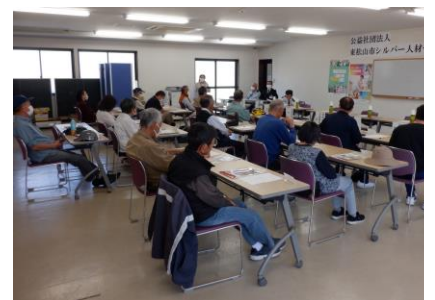
講習会ガイダンス風景