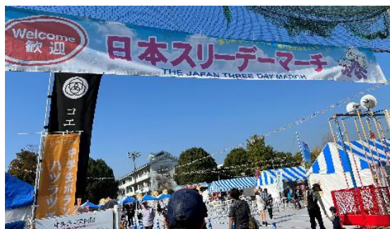
中央会場（松山第一小学校校庭）

パレードと中央会場を取材しましたが、両方ともたいへんな盛り上がりのある大会でした。