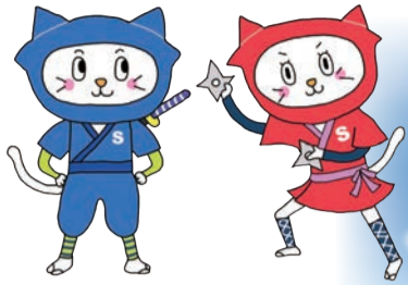
東村山市シルバー人材センター キャラクター「シルバー忍ニヤ」 イラスト：milkpillow