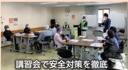
講習会で安全対策を徹底