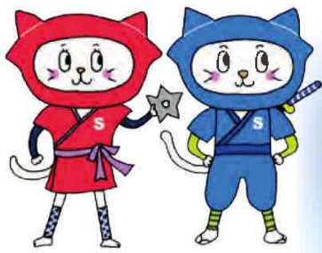
東村山市シルバー人材センター キャラクター「シルバー忍ニャ」 イラスト：みるくぴろ