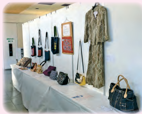
シルバー会員の手作り作品

去る2月、東村山市役所・いきいきプラザにて、東村山市シルバー人材センターの業務内容紹介と合わせて、会員の作品展示イベントを開催しました。