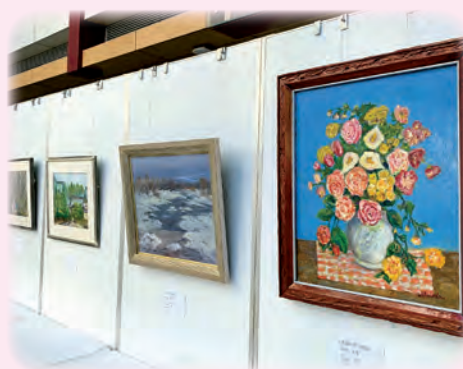
シルバー会員の絵画・写真作品