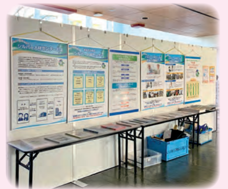
「シルバー人材センター」の紹介