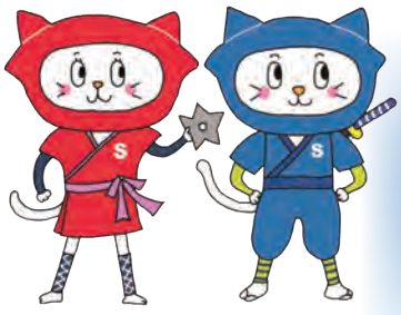
東村山市シルバー人材センター キャラクター「シルバー忍ニヤ」 イラスト：みるくぴろう