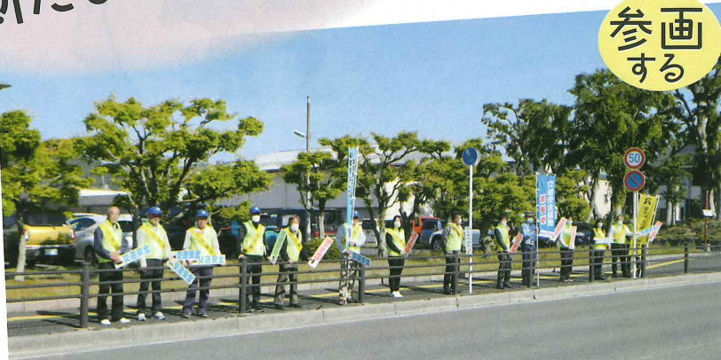
交通安全街頭啓発

東近江市シルバー人材センターのますますの御発展と会員の皆様の御健勝をお祈りいたします。