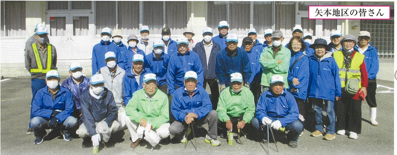
矢本地区の皆さん

発行所 (公社)東松島市シルバー人材センター編集委員会 宮城県東松島市小野字新宮前5番地 TEL 0225(86)1097 FAX 0225(86)1277