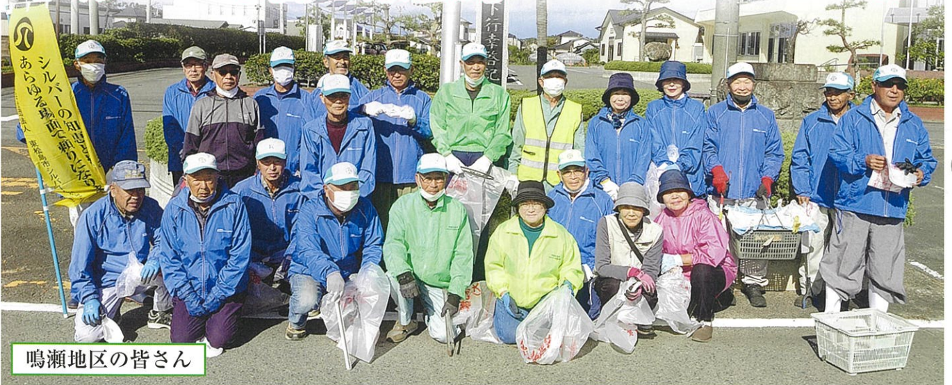
鳴瀬地区の皆さん