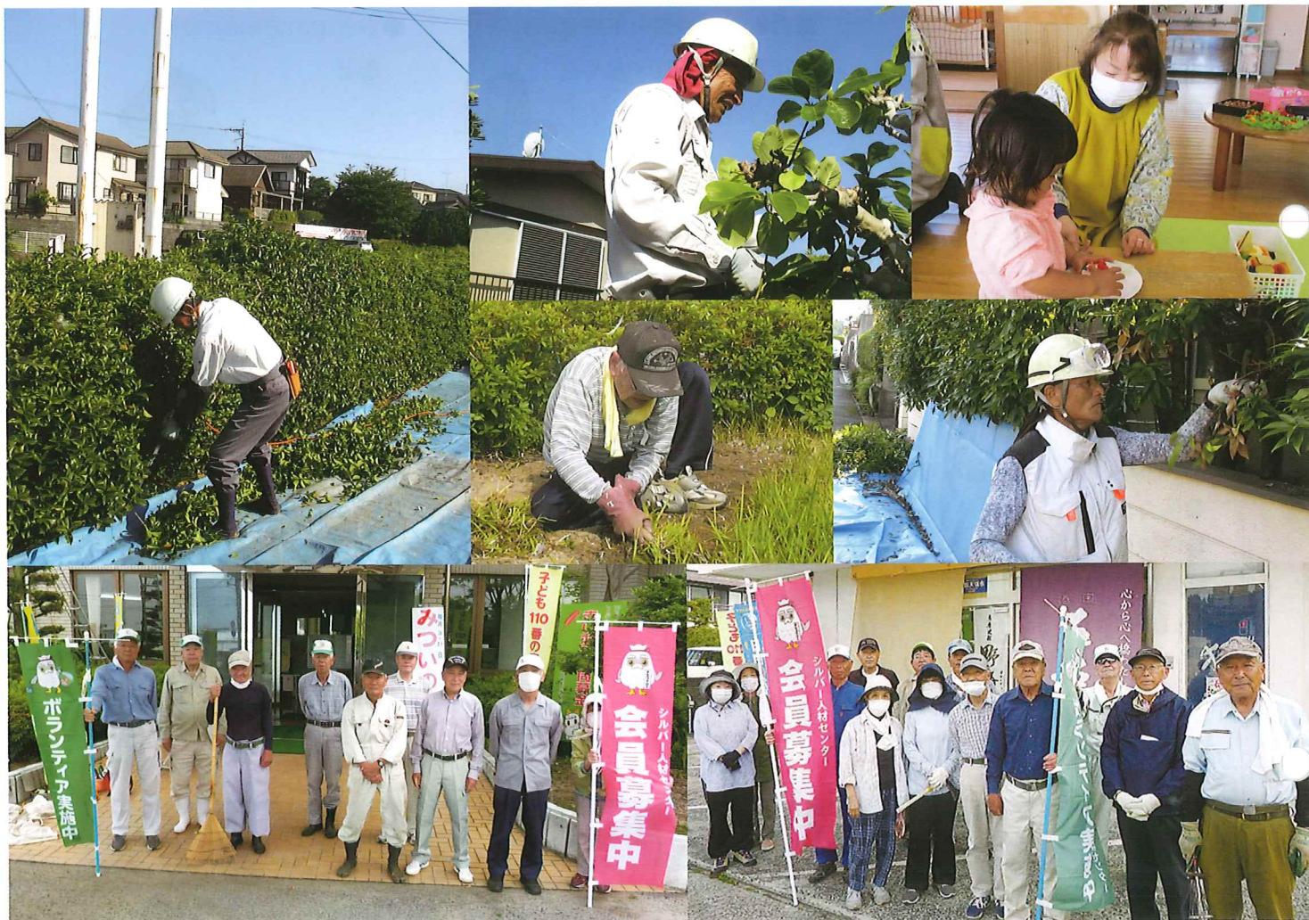
☆ シルバー人材センターの活動風景（上段：就業状況、下段：ボランティア活動）