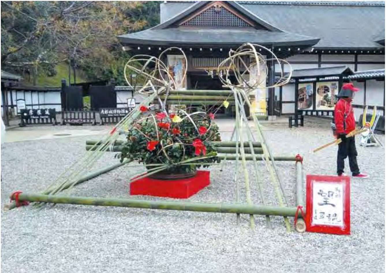
彦根城博物館前の大生け花