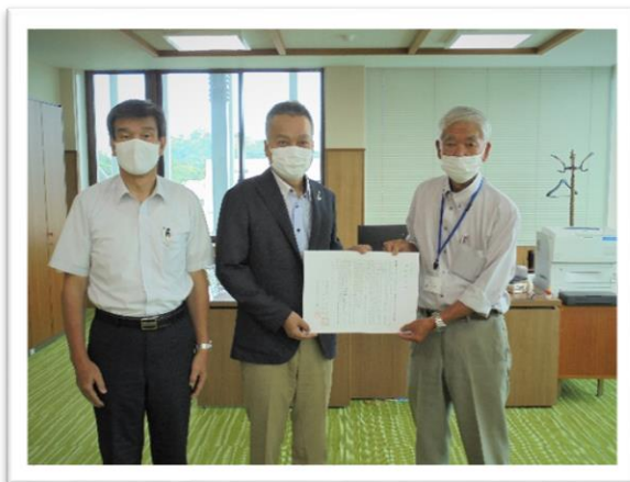
彦根市長(中央)に要望書を提出 [彦根市役所市長室]

当センターの状況を説明するとともに、全シ協の総会において決議された要請文を手渡し、補助金の確保・増額や公共事業におけるシルバー人材センターの利用拡大、消費税におけるインボイス制度導入によるシルバー事業への影響や課題の理解と支援などを要望しました。