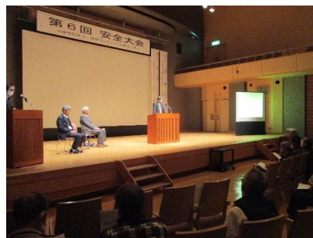
第6回安全大会・安全研修