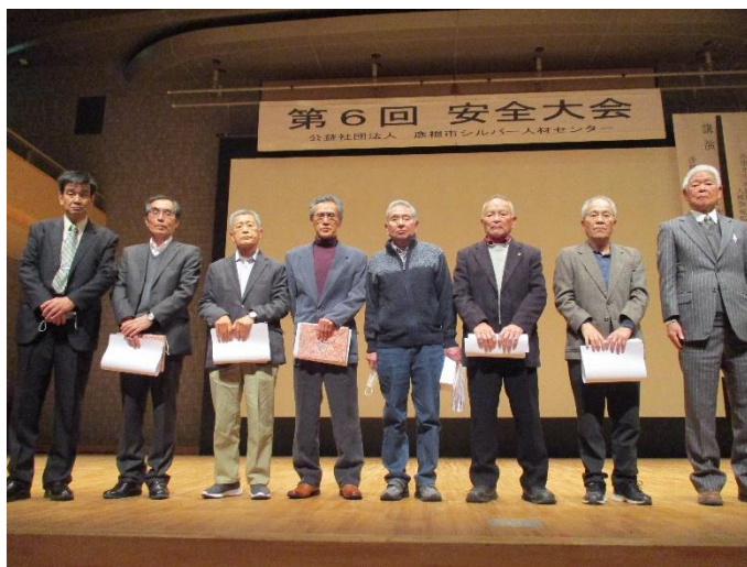
(令和5年度受賞された皆さま)