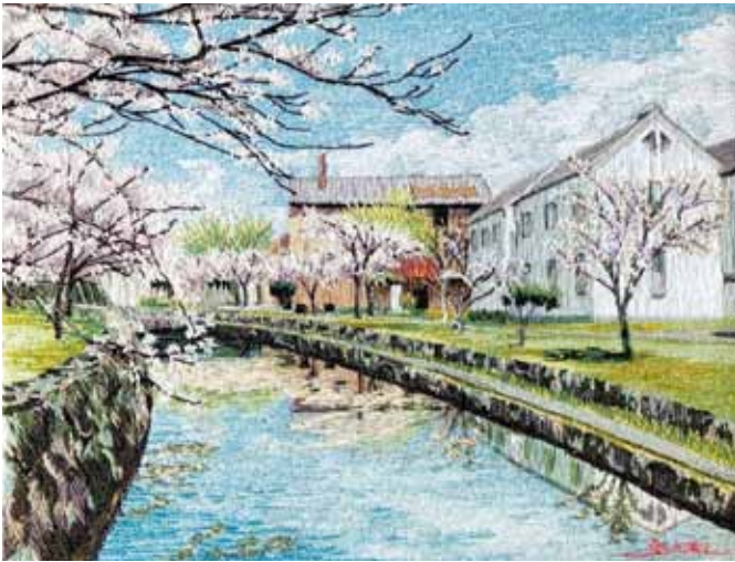
↑滋賀県立大学の風景。