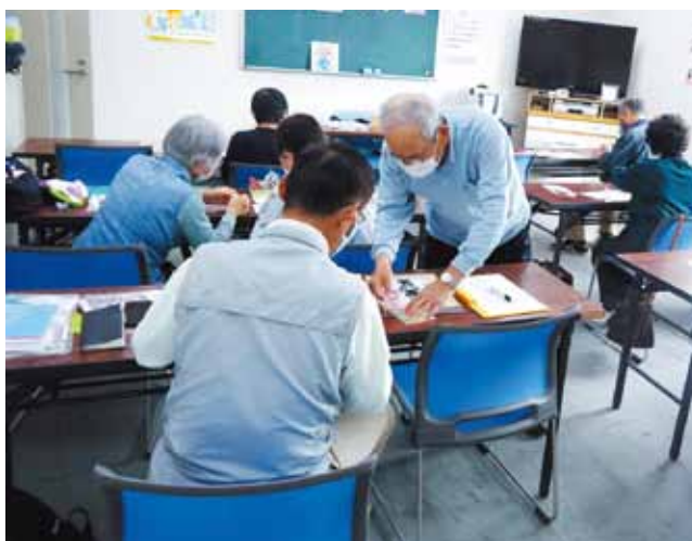
折り紙サークル 毎月 第2水曜日