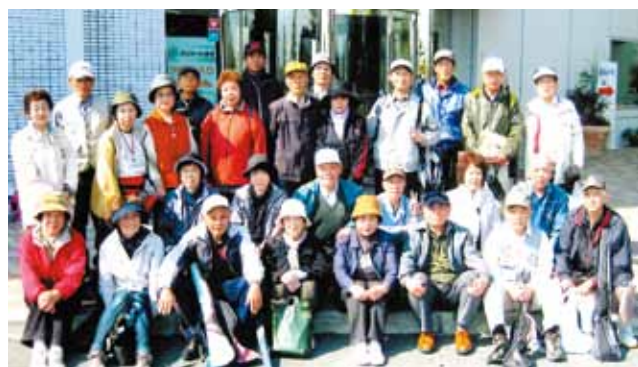
グラウンドゴルフを楽しむ会