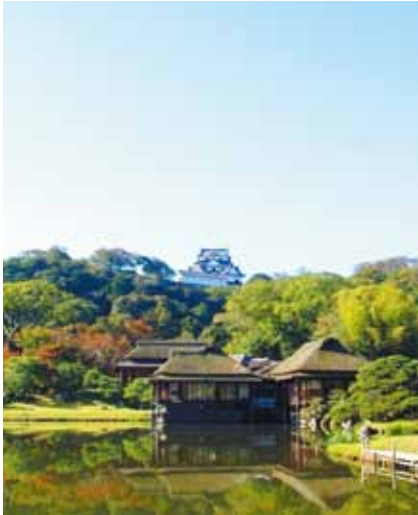
玄宮園から臨む彦根城

現在、今年の国内推薦獲得、令和6年の世界遺産登録を目指して様々な取り組みを行っています。また、地域の皆様の主体的な取組も始まり、着実に登録に向けて進んでいます。