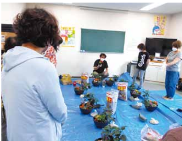
寄せ植え講習会 2021.6 (夏向け)