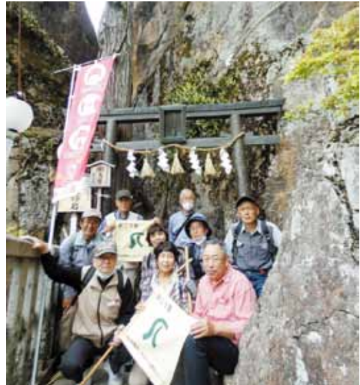
歩こつ会 5月20日 太郎坊宮

PN 日比野 美鈴 早春の優しき陽の道 坂の道 夕陽が丘に古寺巡りつつ 晴れわたる空にピアノのひびくとき が魂は水色に染まる よろこびとかなしみ いずれが多いかと 湖上の花火の明滅に問う