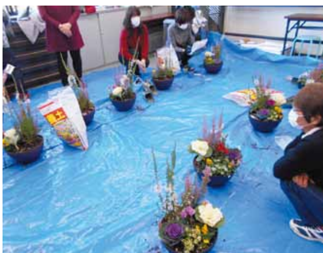
寄せ植え講習会 2021.12 (お正月向け)