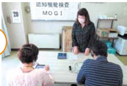
認知機能検査 MOGI体験