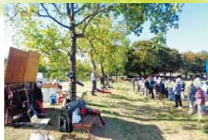
グランドゴルフ大会 令和6年6月 庄堺公園多目的