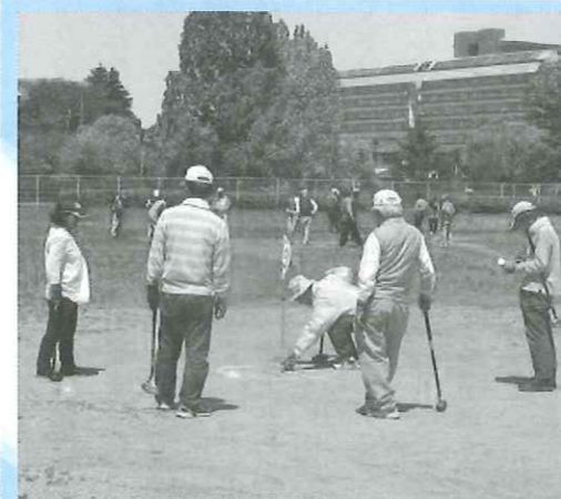
平成28年5月 グラウンドゴルフ親睦大会