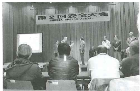
安全就業標語入選作品表彰