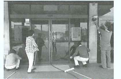
オフィスクリーニング技能講習