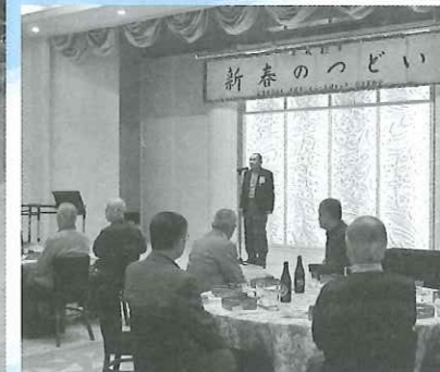
平成28年1月 新春のつどい