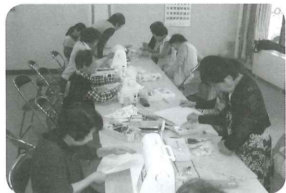
「ほほえみ」第1回交流会

詳細が決まり次第、ホームページでお知らせします。また、事務局へお問い合わせいただくか、お近くの会員にお尋ねください。会員の皆さんには「事務局たより」でお知らせします。女性同士、気楽に楽しく語り合い、新しい生きがいを見つけてみませんか。