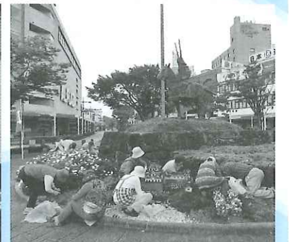
平成27年9月 JR彦根駅前清掃ボランティア