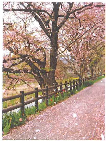
桜散る芹川の散歩道

今年も四月に入ると桜の蕾がふくらみ、花盛りになり、中頃には散らつく花でじゅうたんです。その上を歩くのがちよつぷり可哀想、でも奇麗！。十七日には最後の花びらが風に吹かれて舞い、まるで映画の一シーン、ヒロインのような気持になり佇みながら両手を差しのべ、来年も咲いてやー、