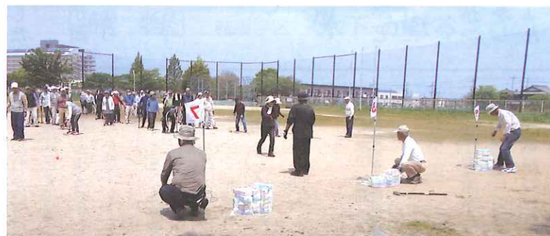
グラウンドゴルフ

シルバーの皆さんが楽しく生活、活動していらっしゃる姿を見て、自分の親も呼ぼうかと思っています。とても好きな彦根です!!