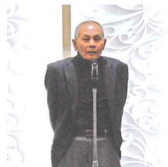
新年会 会長の挨拶