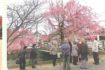
平田川へ花見に行きました。 H29.4.12