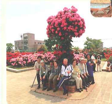
バラ園見学 庄境公園 H29.5.31