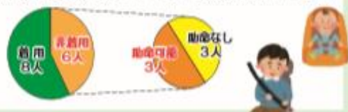
自動車乗車中の死者のシートベルト着用状況(R1年9月末)