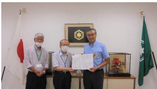
彦根市長(右端)に要望書を提出 [彦根市役所(仮庁舎)特別応接室]