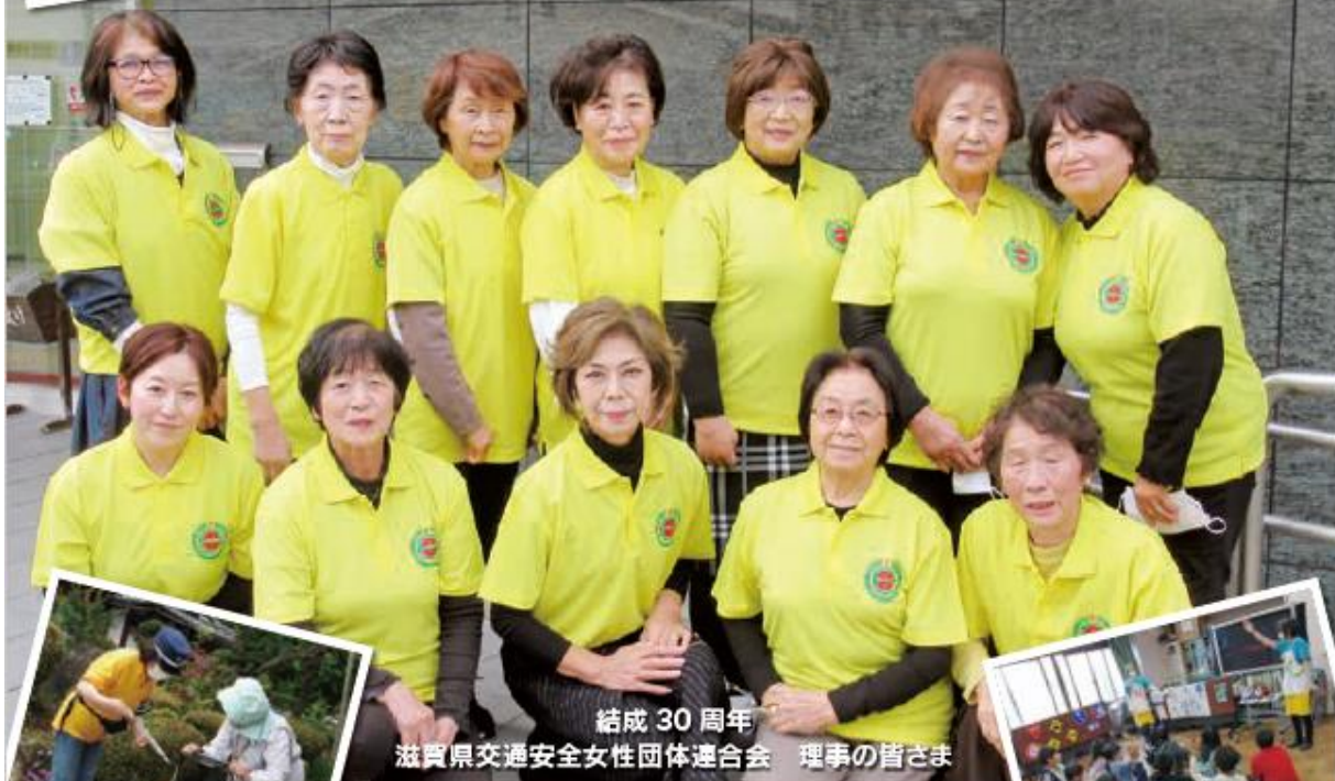
結成 30 周年 滋賀県交通安全女性団体連合会 理事の皆さま