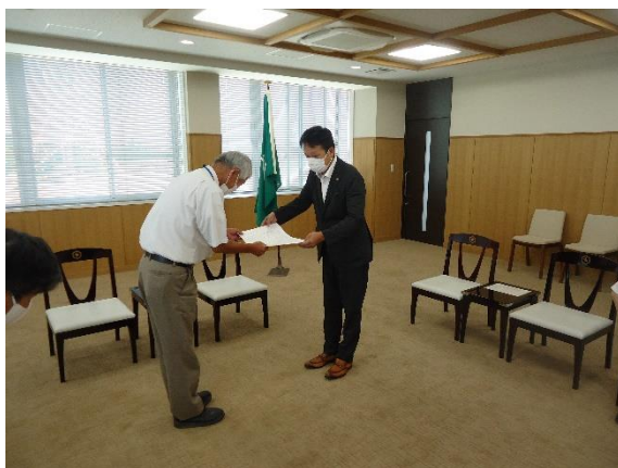
👉 彦根市長(右側)に要望書を提出 [彦根市役所応接室]

当センターの状況を説明するとともに、全シ協の総会において決議された要請文を手渡し、補助金の確保・増額や公共事業におけるシルバー人材センターの利用拡大、消費税におけるインボイス制度導入によるシルバー事業への影響や課題の理解と支援などを要望しました。