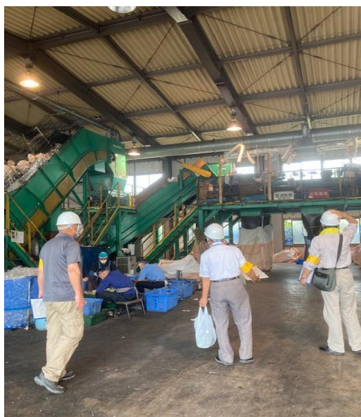
清掃センター プラスチック