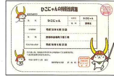
ひこにゃん住民票