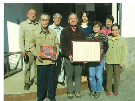
内閣府大臣表章受賞 喜びの皆さん