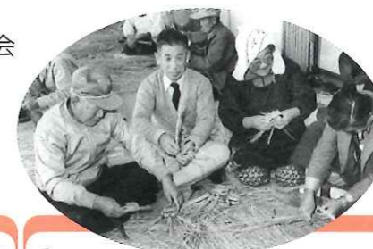
注連縄・草履作り講習会