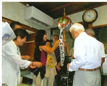
ふれあいの家ひらた オープン

消費税5%から8%に引き上げ（4月） 韓国のクルーズ船セウォル号沈没、高校生ら多数死亡（4月） 広島市北部の土砂災害で74人死亡（8月） 御嶽山噴火死者57人不明6人（9月） 全米テニスで錦織圭選手が準優勝（9月） 青色LEDの開発に成功した、赤崎、天野、中村氏の3人がノーベル物理学賞受賞（10月） 「アベノミクス」の評価を問う衆院選（12月）