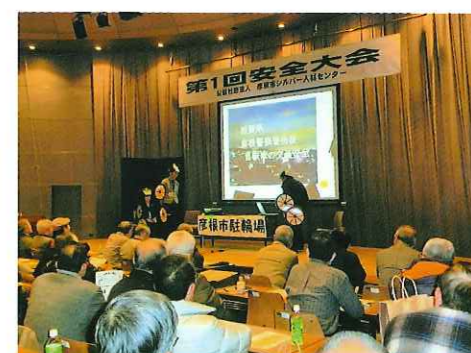
自転車の安全について講演