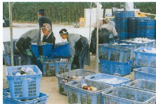
清掃センター選別作業