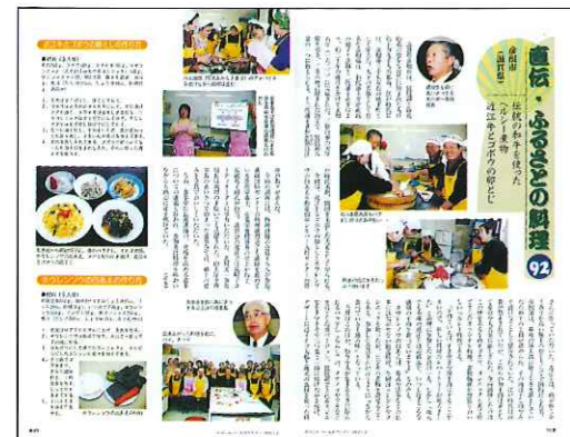
「月刊シルバー人材センター」で郷土料理掲載