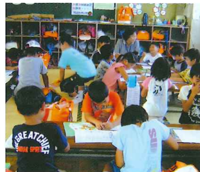
放課後児童クラブ（鳥居本小学校）