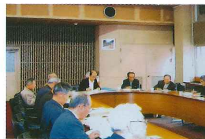
安全就業視察研修