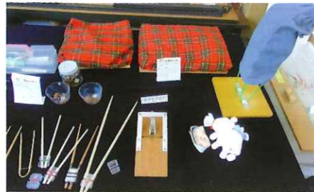
自助具のいろいろ