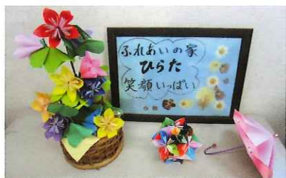
絆でつなごうシルバーパワー事業