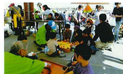
東近江市子育て支援フェスティバル（カロム）