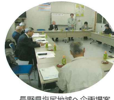
長野県塩尻地域へ企画提案事業について視察研修