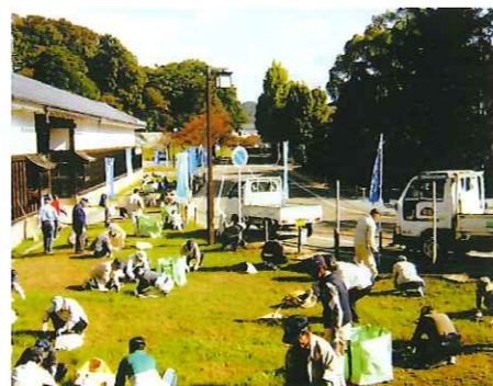
環境美化の日（彦根城周辺）