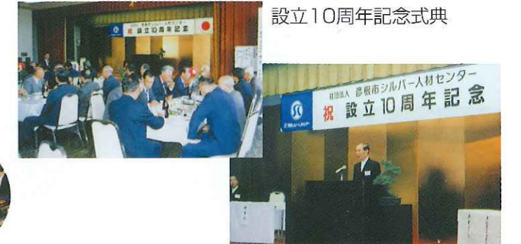
設立10周年記念式典