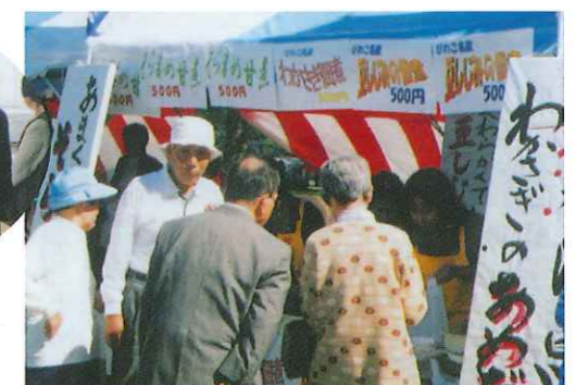
「シルバーフェア滋賀」近江八幡市会場で出店