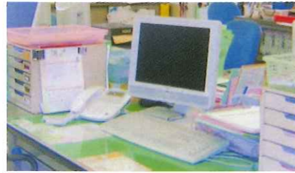
OA機器シルバーシステム・エイジレス80