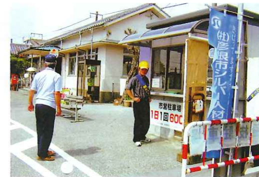
JR稲枝駅前駐車場指定管理受託