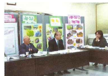
福井市シルバーへ企画提案事業視察研修