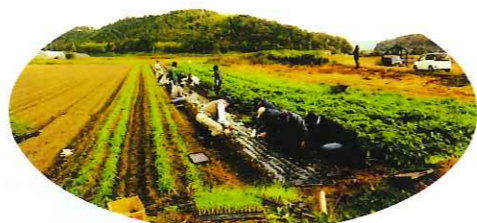
生きがい農園事業