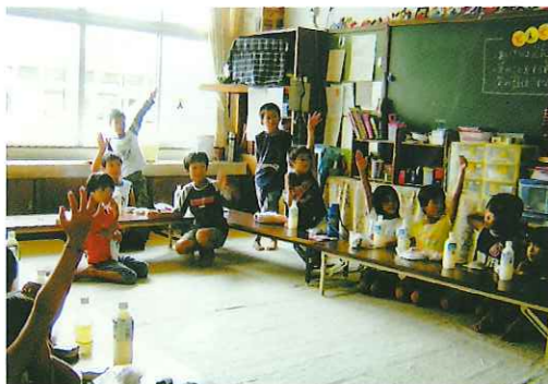
放課後児童クラブ（稲枝西小学校）