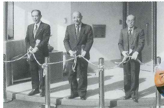
彦根市シルバー人材センター新事務所開所式