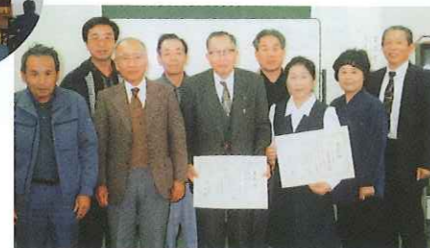
全国シルバー人材センター永年勤続表彰状伝達