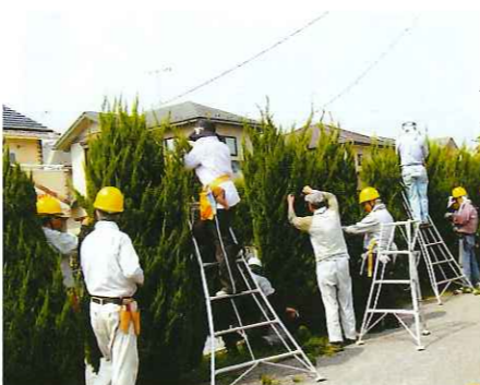
剪定育成班講習会