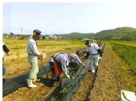
水と緑豊かなふるさと生きがい農園（さつまいも苗植付）