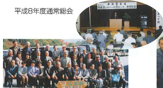
会員親睦旅行 恵那・明治村