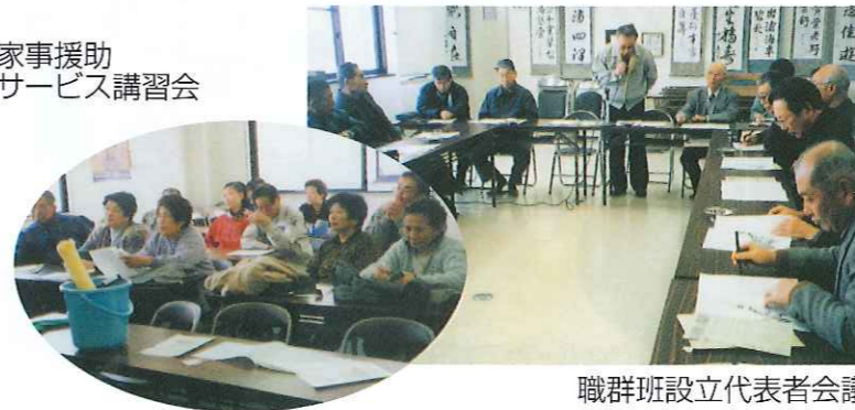
職群班設立代表者会議