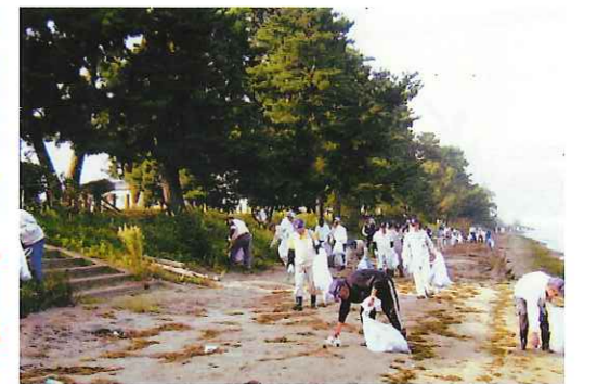
松原湖岸清掃奉仕