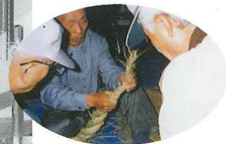
注連縄飾り技能講習