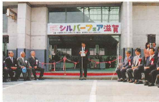
「シルバーフェア滋賀」彦根会場 開会式