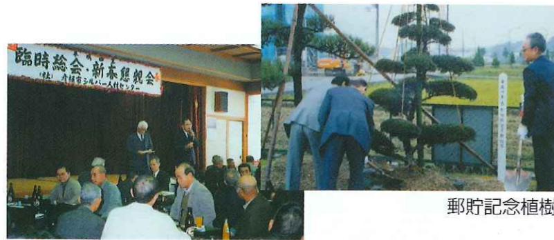
平成5年新春懇親会