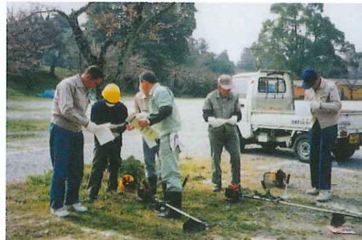
初心者刈払機取扱講習会