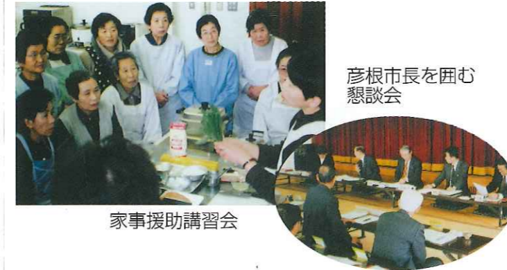
彦根市長を囲む 懇談会