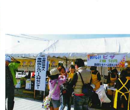
東近江市子育て支援フェスティバル（ピザの販売）