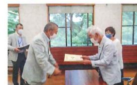
後日センターで会長より表彰状をお渡ししました