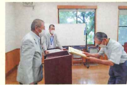
後日センターで会長より表彰状をお渡ししました